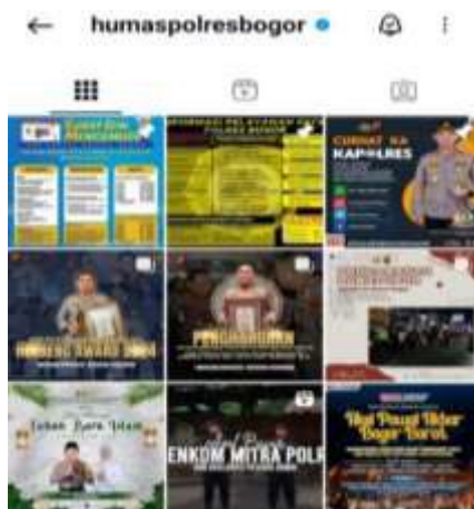
Gambar 2 Feeds Instagram Humas Polres Bogor

Humas Polres Bogor memposting konten yang dibuat menarik dengan menggunakan template sehingga tampilan pada Instagramnya terlihat lebih rapih dan bervariasi. Akun Instagram @humaspolresbogor memposting sebuah konten setiap hari, sehingga Instagram tersebut tetap terlihat aktif. Konten yang diunggah oleh akun Instagram @humaspolresbogor beragam, seperti postingan tentang berita penangkapan, tata cara membuat SIM, SKCK, informasi ganjil-genap, memperingati hari-hari nasional, hingga dokumentasi kegiatan kepolisian yang dilakukan oleh Polres Bogor dan lain-lain.