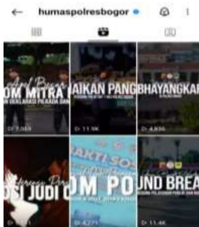
Gambar 3 Reels Instagram Humas Polres Bogor

Humas Polres Bogor memposting konten yang dibuat menarik dengan menggunakan template sehingga tampilan pada Instagramnya terlihat lebih rapih dan bervariasi. Akun Instagram @humaspolresbogor memposting sebuah konten setiap hari, sehingga Instagram tersebut tetap terlihat aktif. Konten yang diunggah oleh akun Instagram @humaspolresbogor beragam, seperti postingan tentang berita penangkapan, tata cara membuat SIM, SKCK, informasi ganjil-genap, memperingati hari-hari nasional, hingga dokumentasi kegiatan kepolisian yang dilakukan oleh Polres Bogor dan lain-lain.